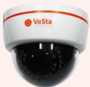
IP камера B2230-LP