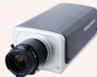
IP камера B2230-LP